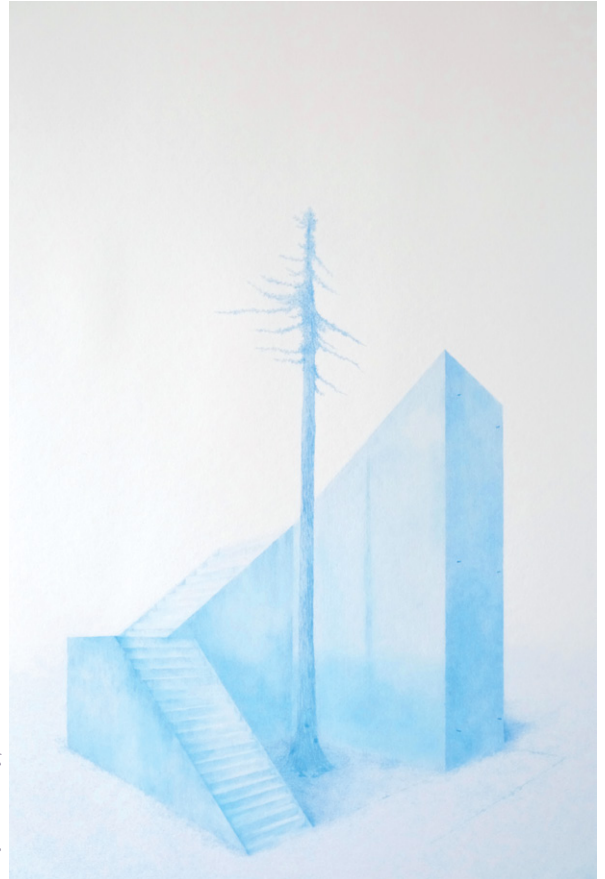
Rémy Hans, Hyperion , 25 x 43 cm, 2022